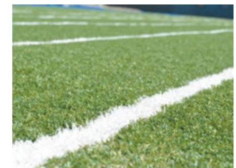
ロングパイルよりも優れた弾力性