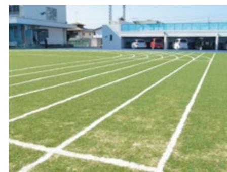
天然芝に近い色鮮やかな人工芝舗装材です