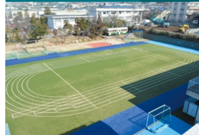
京都教育大附属桃山小学校(京都市伏見区)