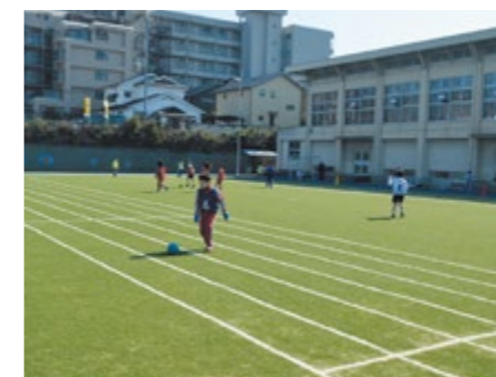
常に安定したコンディションで使用可能